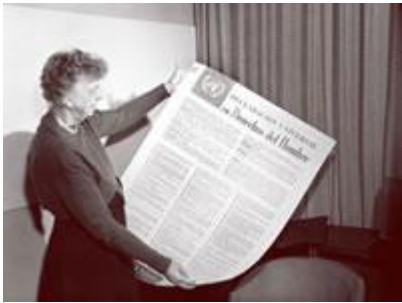
Foto: Eleanor Roosevelt, Presidente de la Comisión de Derechos Humanos para la Declaración Universal de Derechos Humanos en español.

A lo largo de la historia, los conflictos, ya sean guerras o levantamientos populares, se han producido a menudo como reacción a un tratamiento inhumano y a la injusticia. La Declaración de derechos inglesa de 1689, redactada después de las guerras civiles que estallaron en este país, surgió de la aspiración del pueblo a la democracia. Exactamente un siglo después, la Revolución Francesa dio lugar a la Declaración de los Derechos del Hombre y del Ciudadano y su proclamación de igualdad para todos. Sin embargo, muy a menudo, se considera que el Cilindro de Ciro, redactado en el año 539 a.C. por Ciro El Grande del Imperio Aqueménida de Persia (antiguo Irán) tras la conquista de Babilonia, fue el primer documento sobre derechos humanos. En cuanto al Pacto de los Virtuosos (Hilf-al-fudul) acordado por tribus árabes en torno al año 590 d.C., es considerado una de las primeras alianzas de derechos humanos.